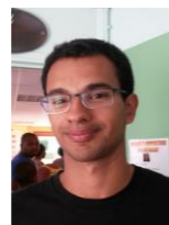
Luc AEL A.M.T Form. DE